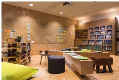
BU: Raum Idea Space Two Seminaris Hotel Bad Honnef