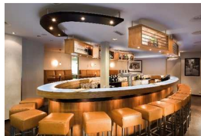
BU: Bar Seminaris Hotel Bad Honnef