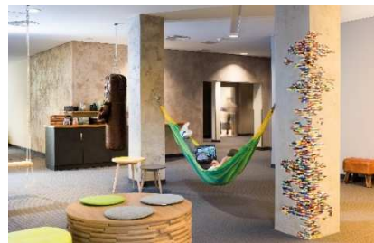
BU: Konferenz-Foyer Seminaris Hotel Bad Honnef